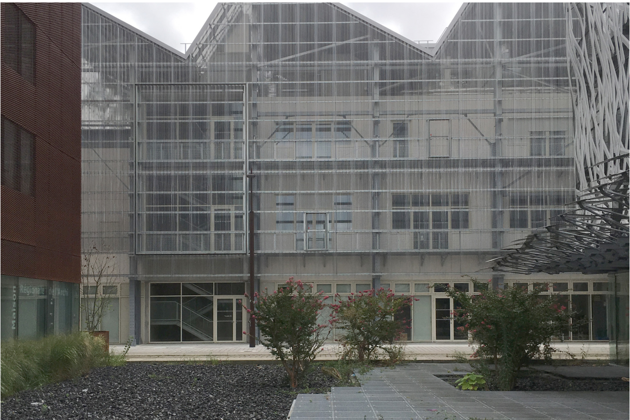
De school voor Schone Kunsten Nantes Saint-Nazaire, gebouwd op de site van de voormalige hallen van Alstom, die tot in 2001 in gebruik waren.