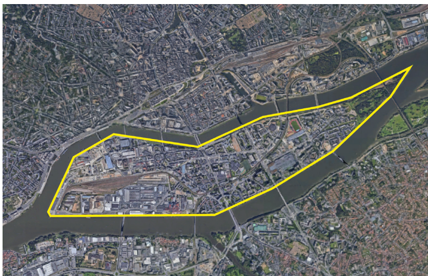
Luchtfoto Ile de Nantes