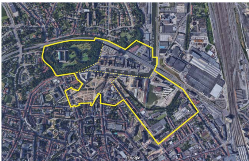
Vue aérienne Vaartkom

D'un quartier industriel à un quartier urbain vert et animé