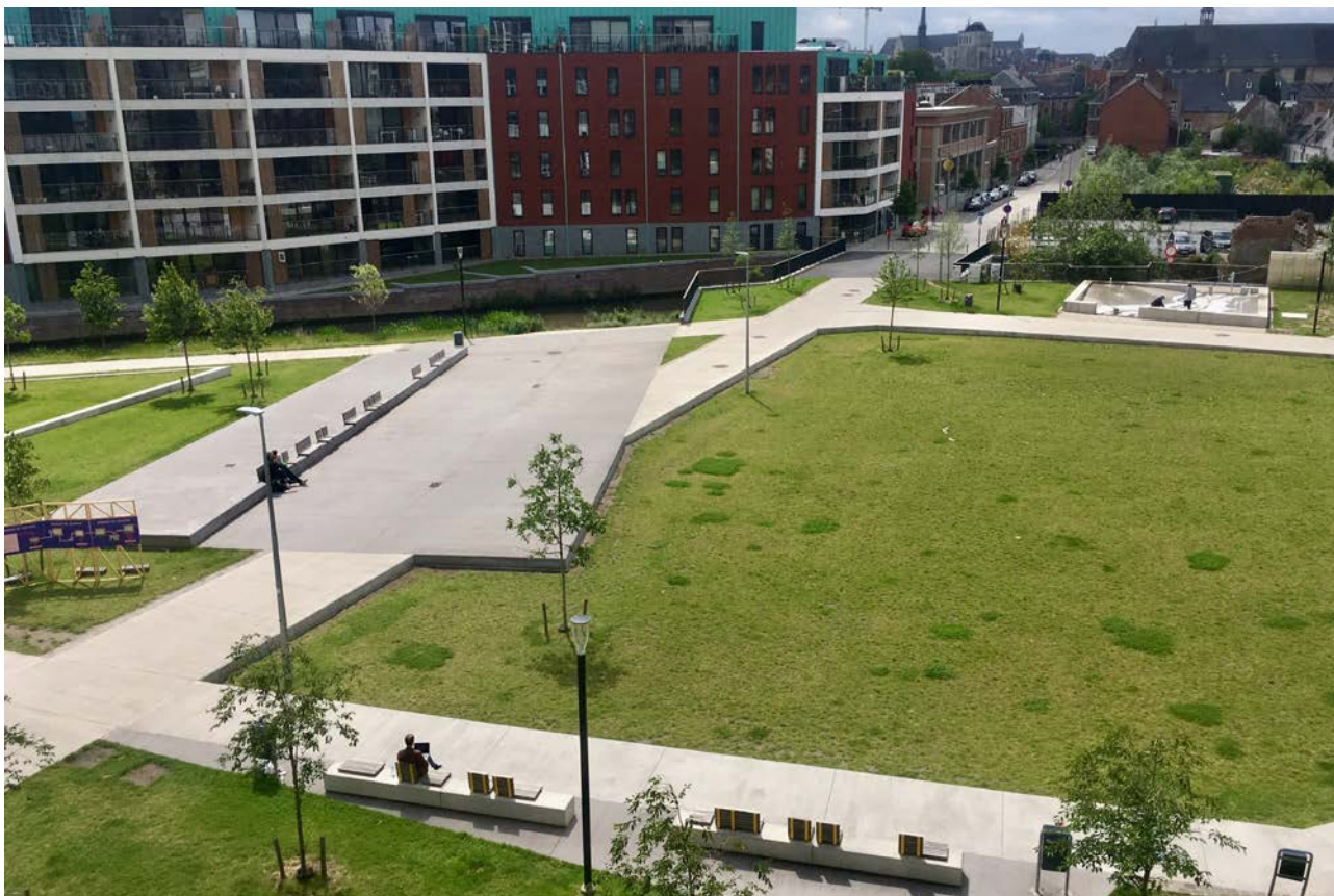
Les berges verdurisées de la Dyle