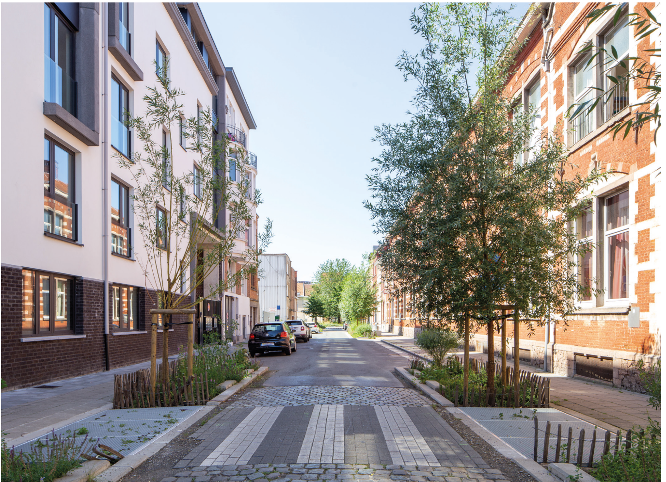
Séverin Malaud © urban.brussels

De ontwikkelingen zorgen niet alleen voor een betere voetgangers- en fietsverbinding tussen de wijken en een betere bereikbaarheid van en naar het station Vorst-Oost. Groene ruimten worden gebruikt als recreatieruimten voor de wijken en de stad. Ruimte wordt gegeven aan vrije tijd, vertoeven, sport en spel.