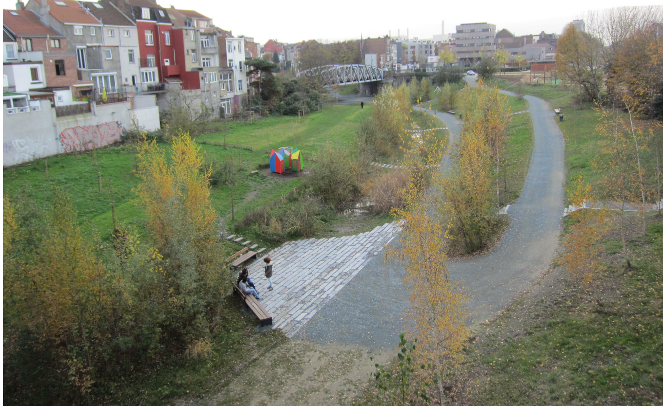
Pierre Molter © Bruxelles Environnement

Dit park maakt deel uit van een algemene groene structuur. Deze groene zone, gedeeltelijk gerealiseerd, uitgevoerd door verschillende bouwheren en in verschillende fasen, zal de groene ruggengraat vormen van de nieuwe vastgoedprojecten op de site van Thurn en Taxis.