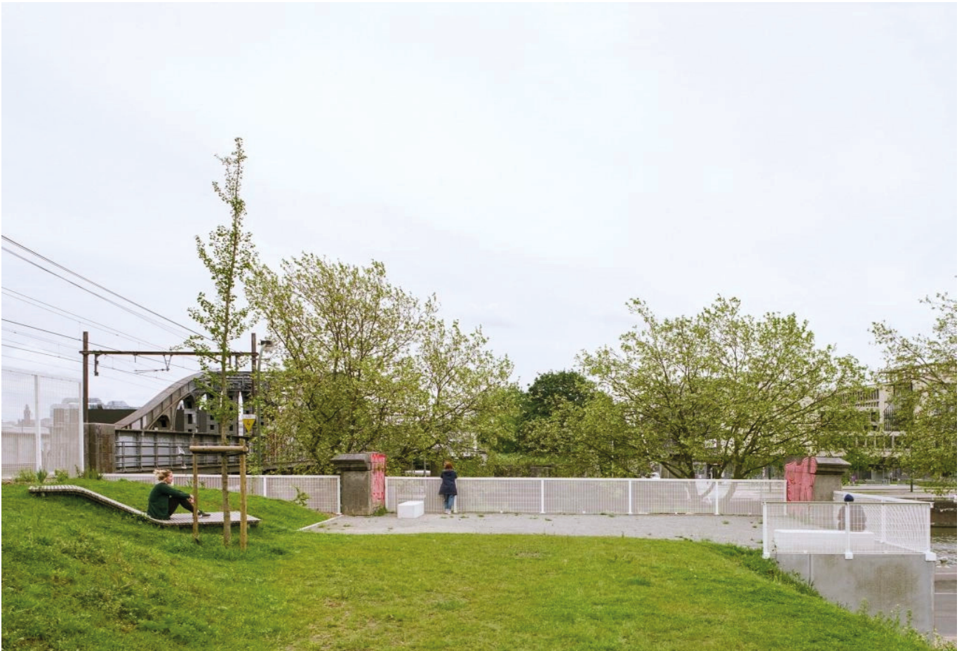
Séverin Malaud © urban.brussels

De oprichting van pocketparken is ontworpen met de betrokkenheid van omwonenden. De herwaardering van braakliggende terreinen midden in de stad kan leiden tot herbestemming van de omgeving door omwonenden, tot het ontstaan van sociale samenhang. Aan de ontwikkeling van deze kleine parken ging een proces van burgerparticipatie vooraf. De buurtbewoners hebben samen een moestuin aangelegd, activiteiten georganiseerd om de ruimte te activeren en hebben meegedacht over de ontwikkeling en het gebruik van deze nieuwe gemeenschappelijke terreinen.