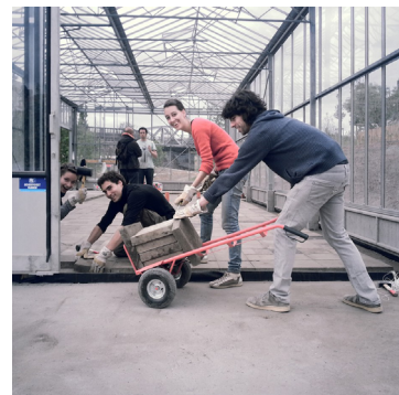
Bouw van de Farmhouse-serre

Na afloop van de biënnale ParckDesign werd uiteindelijk beslist om het paviljoen in het park te behouden. De serre bevat ook andere herbruikbare materialen (een roestvrijstalen spoelbak, een koelkast, een regenwassertank met een volume van 1 m 3 ).