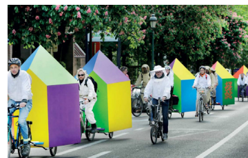
Mobiele 'Bee-Car' bijenkasten