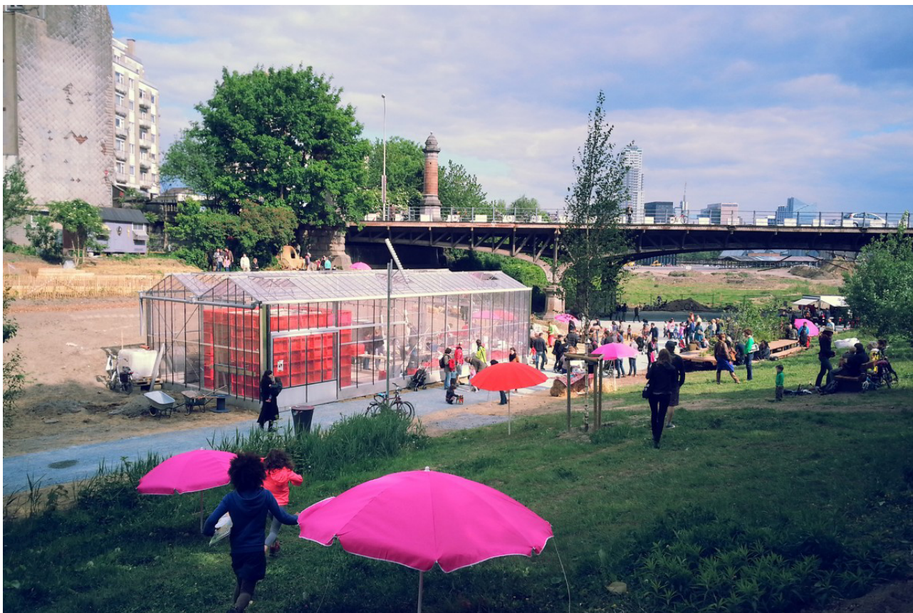
Bouw van de Farmhouse-serre