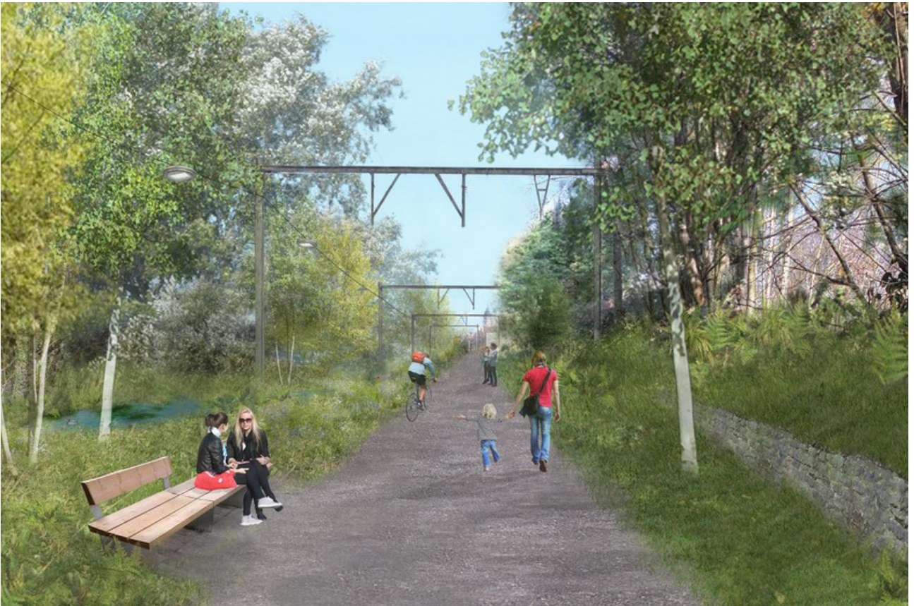
Een park dat de wijken met elkaar verbindt. Hier sectie L28