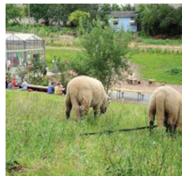
Schapen tijdens ParckDesign 2014