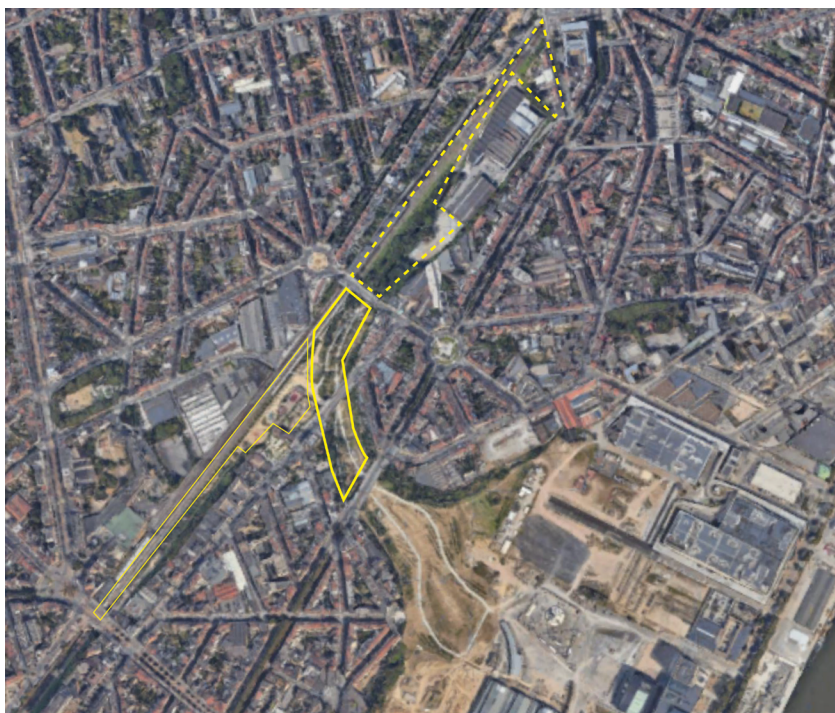
Luchtfoto: in doorlopende lijn het aaneengesloten groene gebied, in stippellijn het L28-park, binnen de cirkel Parckfarm.

De site Thurn & Taxis is gelegen tussen de gemeenten Molenbeek, Jette en Laken. Het park zorgt voor een verbinding tussen deze gemeenten. Het strekt zich uit van het kanaal Brussel-Charleroi tot het nieuwe stadspark L28.