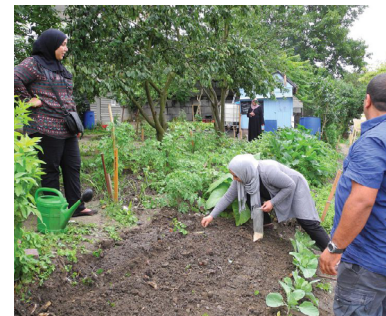
Bewoners in de moestuin