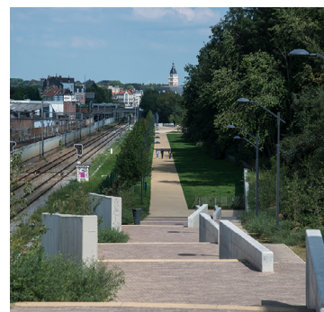
Groene verbindingen tussen de wijken. Hier het L28-park.