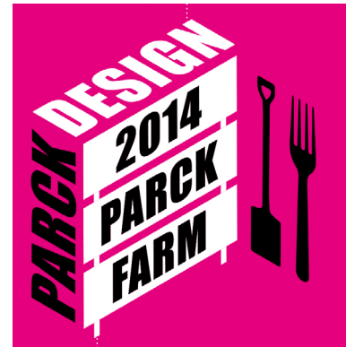
Affiche ParckDesign 2014

De vereniging Parckfarm T&T, die is voortgekomen uit de ervaring met ParckDesign 2014, is een realiteit die door en voor de bewoners zelf wordt ondersteund met als doel de openbare ruimte te animeren en de burgers te ondersteunen bij de uitvoering van projecten, workshops, buurtfeesten en tal van andere burgerinitiatieven. De actoren proberen